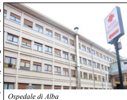
Ospedale di Alba

del certificato o richiederne un'eventuale integrazione o controllo. L'ammissibilità o meno dei certificati rilasciati dalle strutture ospedaliere o di pronto soccorso, - supponendo che vengano regolarmente spediti all'INPS con le relative integrazioni da parte dei lavoratori interessati - dipende pertanto dalla singola valutazione dell'INPS. Nel caso l'INPS non intenda accettare l'erogazione della prestazione di malattia al lavoratore (inviando idonea comunicazione all'azienda) la stessa potrà essere recuperata da un cedolino paga futuro (così come anche la