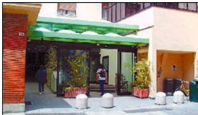
Ingresso ospedale di Alba

Il nostro ufficio paghe è a disposizione per eventuali ulteriori informazioni o per l'espletamento delle pratiche relative (tel. 0173/226609).